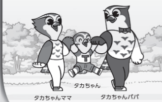
タカちゃんママ タカちゃん タカちゃんパパ