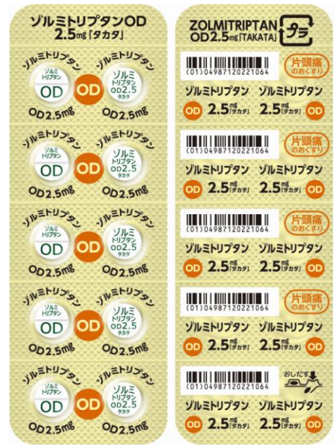
(ゾルミトリプタン OD 錠 2.5mg 「タカタ」の10錠 PTP シート例)

錠剤印刷機は素錠・OD錠・フィルムコーティング錠のすべてに印刷可能な機器を配備し、錠剤の割線に合わせた表裏印刷や読みやすい文字など、識別し易い安心品質を提供してまいります。