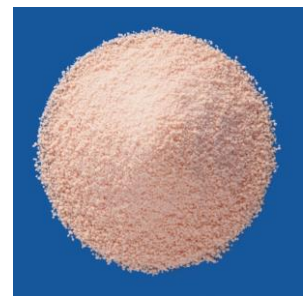
(トスフロキサシントシル酸塩細粒小児用 15% 「タカタ」)

—お問合せ先— 高田製薬株式会社 広報・渉外担当 TEL 048 - 622 - 2602 FAX 048 - 623 - 3065