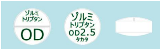
(ゾルミトリプタン OD 錠 2.5mg 「タカタ」の例)

薬剤過誤の防止の観点から、錠剤の表・裏に成分名・含量・屋号を印字、PTP包装の1錠ずつにピッチコントロール印刷による製品名表示を行いました。更に利便性向上のため、ピロー包装に使用期限・製造番号を印字した製品を流通開始いたします。