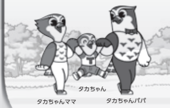
タカちゃん タカちゃんママ タカちゃんパパ